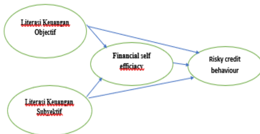
Gambar 1. Kerangka Konseptual Penelitian

Mengingat analisis ekstensif dari literatur yang tersedia dan studi sebelumnya, kerangka kognitif yang digunakan dalam penyelidikan ini dapat diringkas seperti ini: